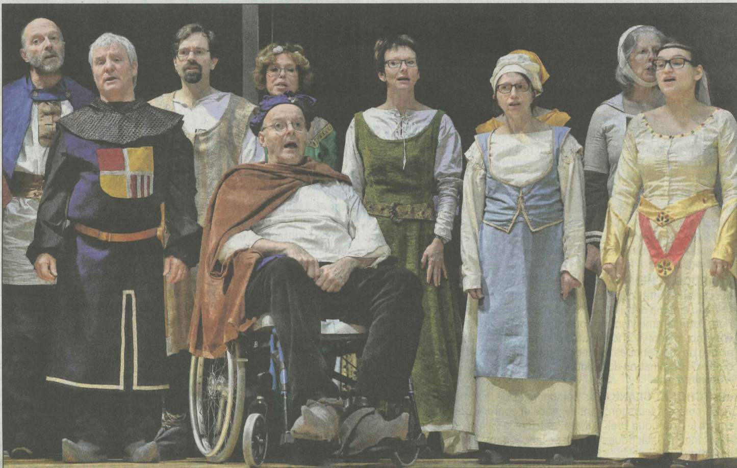
Le spectacle-anniversaire de la Chanson des 4 saisons est conçu comme une suite chorale entrecoupée de saynètes humoristiques. V. MURITH

Ces costumes-là n'ont pas la volonté d'être des reproductions fidèles au Fribourg du passé, ex-